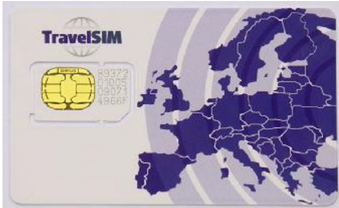
Abbildung 2. - Layout Rückseite: